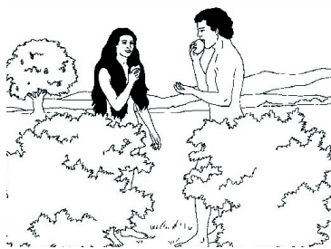
KRONOLOGISK BILDE NR. 5, «MENNEKSET FALLER I SYND»