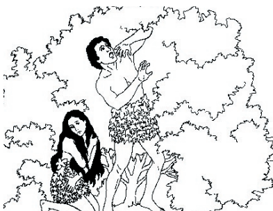
KRONOLOGISK BILDE NR. 6, «KLÆR AV FIKENBLAD»

Tema: Gud er kjærlighet. Han er miskunnelig og nådig.