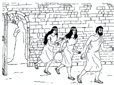
KRONOLOGISK BILDE NR. 16, «LOT OG DØTRENE HANS FLYKTER»

Gud visste hva som bodde i hjertet til kona til Lot.