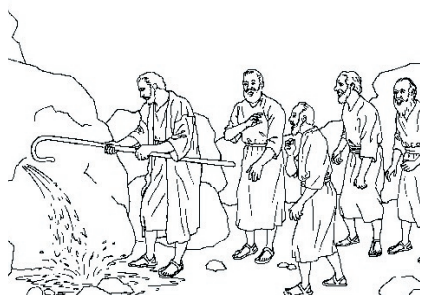
KRONOLOGISK BILDE NR. 31, ”MOSES SLÅR KLIPPEN OG FÅR VANN”

Gud sa til Moses at han skulle slå på klippen med staven sin. Gud sa at Han ville gi dem vann fra klippen.