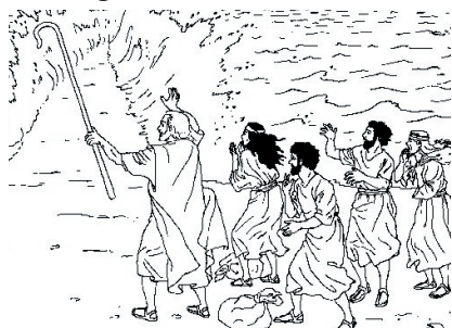
KRONOLOGISK BILDE NR. 29, ”ISRAELITTENE GÅR OVER RØDE HAVET.”