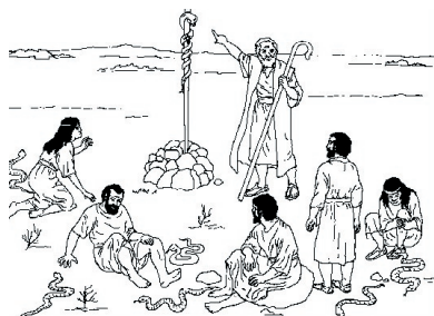
KRONOLOGISK BILDE NR. 37, ”KOPPERSLANGEN I ØRKENEN”