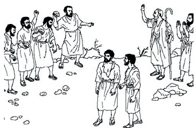
KRONOLOGISK BILDE NR. 38, "JOSVA OG KALEB"