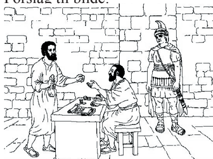
KRONOLOGISK BILDE NR. 49, ”ROMERSK EMBETSMANN”