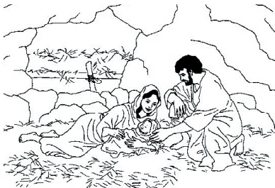
KRONOLOGISK BILDE NR. 54, ”JESUS ER FØDT.”