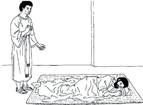
KRONOLOGISK BILDE NR. 53, ”EN ENGEL TALTER TIL JOSEF.”

Tema: Gud er kjærlighet. Han er miskunnelig og nådig.