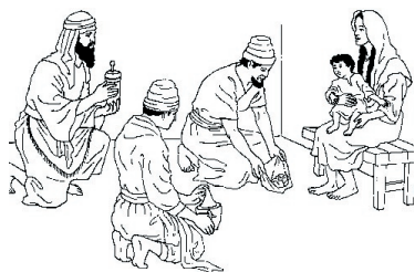
KRONOLOGISK BILDE NR. 57, ”DE VISE MENN.”