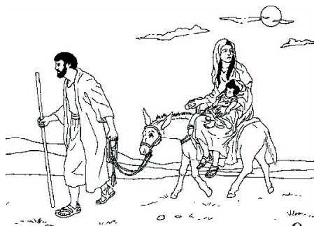
KRONOLOGISK BILDE NR. 58, "FLUKTEN TIL EGYPT."