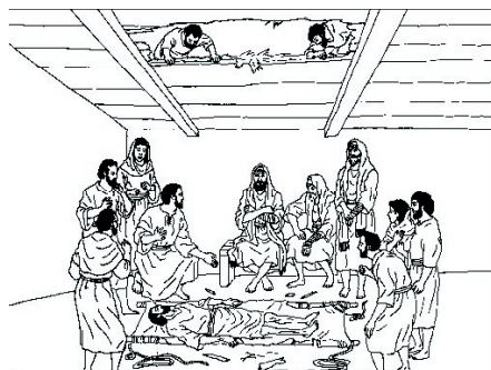
KRONOLOGISK BILDE NR. 65, "JESUS HELBREDER DEN LAMME MANNEN"

D. Jesus tilga den lamme mannen hans synd.