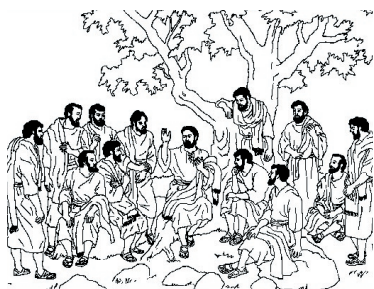
KRONOLOGISK BILDE NR. 66, ”JESUS OG DE TOLV DISIPLENE”