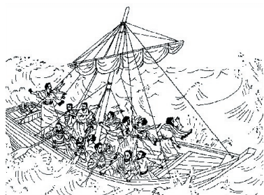
KRONOLOGISK BILDE NR. 68, "JESUS STILLER STORMEN."