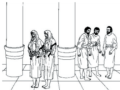
KRONOLOGISK BILDE NR. 72, «TRADISJONENE TIL FARISEERNE»