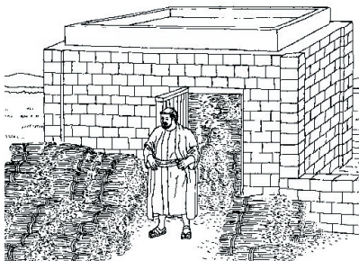
KRONOLOGISK BILDE NR. 78, «DEN RIKE BONDEN»

Denne rike bonden trodde at han hadde alt han trengte.