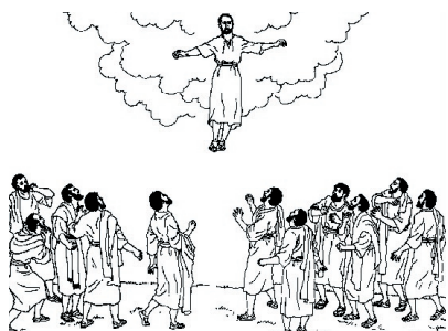
KRONOLOGISK BILDE NR. 90, «HIMMELFARTEN»