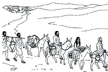
KRONOLOGISK BILDE NR. 14 «ABRAHAM REISER FRA KARAN»